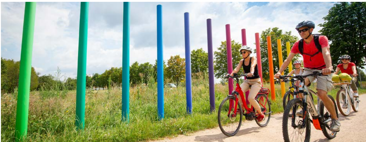
Radfahrer auf dem großen Dreiland-Radweg (vom TEB getragenes Interreg-Projekt)

Projekte werden in erster Linie von TEB-Mitgliedern getragen, können aber dem TEB übertragen werden, wenn kein anderer Projektträger gefunden wird und dies einem trinationalen Bedürfnis entspricht.