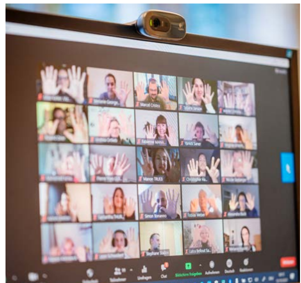
Online-Bürgerdialog zur Corona-Pandemie

ÖPNV-Verbindungen – die Ideen sind vielfältig und betreffen zahlreiche Lebensbereiche der Einwohnerinnen und Einwohner der Region. Diese Projektideen werden nun einen dieser zwei Wege gehen: entweder – wenn sie an andere Akteure gerichtet sind oder die Kompetenzen des TEB übersteigen – werden sie an die entsprechenden Partner und Institutionen weitergegeben oder – wenn sie im Kompetenzbereich des TEB liegen – sie werden in den politischen Instanzen und den Arbeitsgruppen des TEB diskutiert und auf Machbarkeit geprüft.