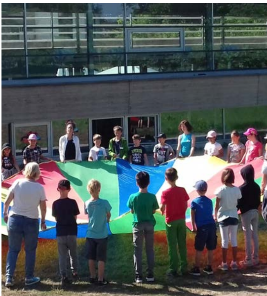
Projekt des Klassenbegegnungsfonds

Der TEB trägt dazu bei, die Mehrsprachigkeit der Bevölkerung zu fördern, um so die Bedingungen für den trinationalen Austausch und Begegnungen zu verbessern. Der TEB leistet dadurch einen Beitrag, um den Zugang zum grenzüberschreitenden Arbeitsmarkt im Nachbarland zu erleichtern.