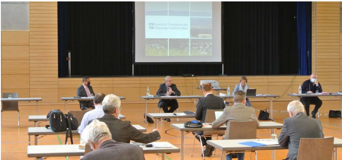
Mitgliederversammlung des TEB 2020, in Maulburg (D)

Der TEB fördert die persönlichen Kontakte und den Informationsaustausch zwischen seinen Mitgliedern.