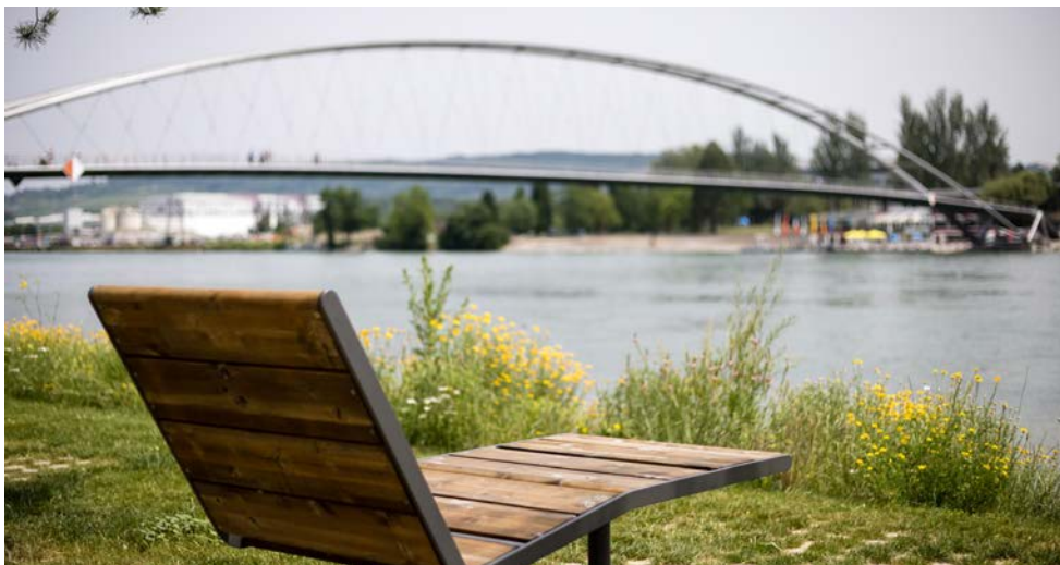
Park Vis-à-vis in Huningue (vom TEB getragenes Interreg-Projekt)

Der TEB stellt seinen Mitgliedern Informationen zum Interreg-Programm der EU und weiteren Fördermöglichkeiten zur Verfügung und gilt bei Projektideen als Ansprechinstanz.