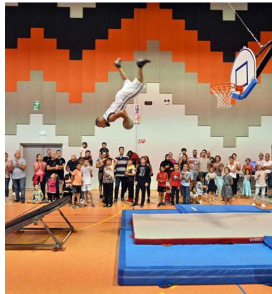
Projekt Begegnungsfonds Festival Straßenkunst, Saint-Louis