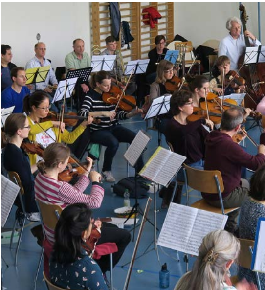
Projekt Begegnungsfonds grenzüberschreitende Musikprobe, Trirhenum

Die Bevölkerung der trinationalen Agglomeration wird in Diskussionen zu grenzüberschreitenden Themen und Projekten einbezogen.