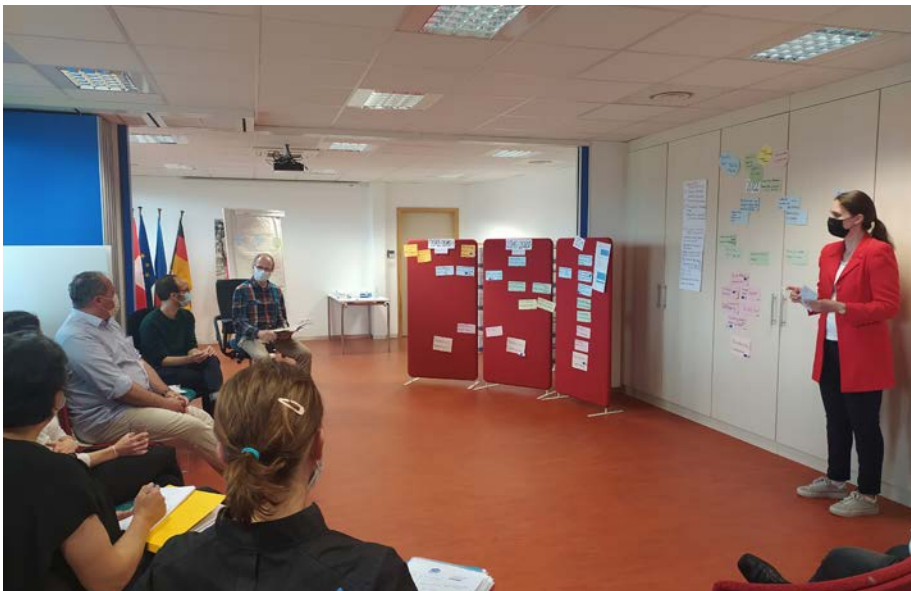
Austausch zwischen Experten der Stadtplanung beim Workshop zum 3Land, Juni 2021

Der TEB vertritt trinational abgestimmt die Region und ihre Anliegen auf regionaler, nationaler und europäischer Ebene.