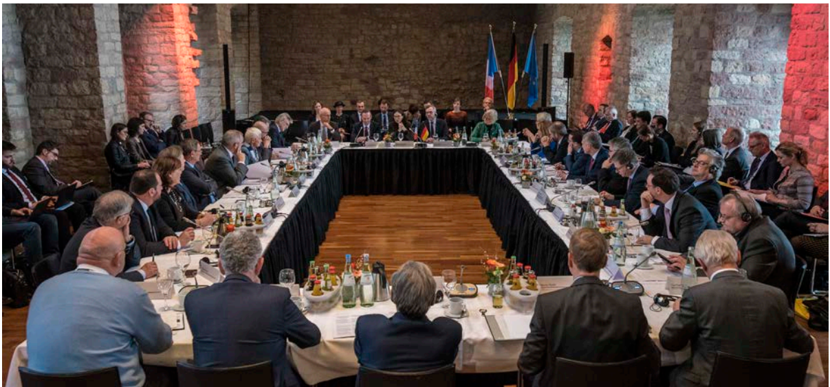
Sitzung des Ausschusses für grenzüberschreitende Zusammenarbeit, 2019, in Hambach (D)

Der TEB trägt dazu bei, Hindernisse der grenzüberschreitenden Zusammenarbeit zu identifizieren und diese im Austausch mit den im Ausschuss vertretenden Akteuren zu benennen und einer Lösung zuzuführen.