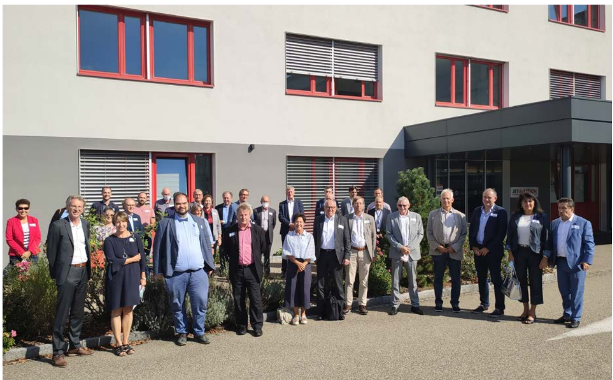
Delegiertentag 2021 mit TEB-Mitgliedern, Besichtigung von Jet Aviation

Die Mitglieder werden fortlaufend in die TEB-Aktivitäten eingebunden und tragen zur politischen und Projektarbeit des TEB bei.