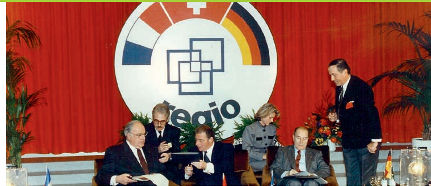
Am Treffen von Bundeskanzler Helmut Kohl, Bundespräsident Jean-Pascal Delamuraz und Staatspräsident François Mitterrand anlässlich des Regio-Gipfels am 15. Dezember 1989 in Basel zum 25-jährigen Jubiläum der Regio Basiliensis wurde die transregionale und interregionale Kooperation auf nationaler Ebene erstmals gewürdigt.

MÖCHTEN AUCH SIE MITGLIED WERDEN? NEHMEN SIE KONTAKT ZU UNS AUF: INFO@REGBAS.CH ODER +41 61 915 15 15.