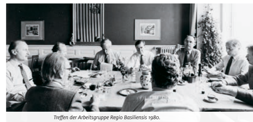
Treffen der Arbeitsgruppe Regio Basiliensis 1980.

Die Regio Basiliensis ist heute eine wichtige Partnerin und Anlaufstelle auf Schweizer Seite für die grenzüberschreitende Zusammenarbeit. Sie gibt mit ihrer Trinationalen Pendenzenliste Impulse und Denkanstösse in den für die Region zentralen Themen und leistet aktive Beiträge für einen prosperierenden Wirtschafts-, Wissenschafts- und Kulturstandort. Wir sind stolz, unsere Aufgaben als Kompetenzzentrum zur Förderung der grenzüberschreitenden Zusammenarbeit am Oberrhein wahrzunehmen und freuen uns, dies auch in Zukunft zu tun!