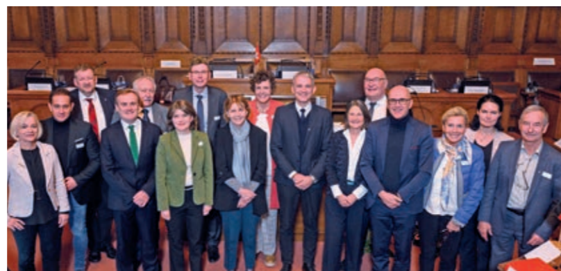
Die Teilnehmenden der Plenarversammlung der ORK aus Deutschland, Frankreich und der Schweiz unter der Schweizer Präsidentschaft.

Die Coronapandemie und die Energiemangellage haben gezeigt, dass viele aktuelle Herausforderungen eine Abstimmung über die Landesgrenzen erfordern, so zum Beispiel auch die Homeoffice-Regelung bei Grenzgängerinnen und Grenzgängern. Die ORK bildet hierbei die zentrale Austausch- und Initiativplattform im Bereich der grenzüberschreitenden Verwaltungszusammenarbeit. Im Rahmen von zwei Kon-