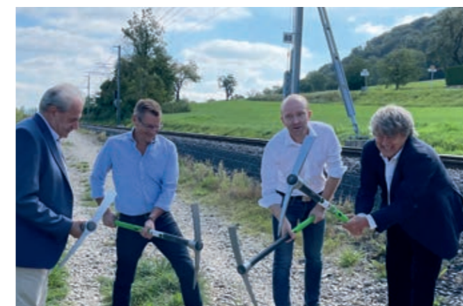
Ein neuer Veloweg verbindet die Gemeinden Bättwil, Leymen und Rodersdorf entlang der BLT-Tramlinie 10. Mit dieser grenzüberschreitenden Verbindung wird der Radverkehr im Alltag und auch für Freizeit und Tourismus gestärkt. Planung und Bau werden durch Interreg Oberrhein unterstützt. Der Bau begann am 1. September 2022, wobei sich Vertreter der beteiligten Gemeinden zum ersten Spatenstich trafen.

Anfangs 2023 wurden die ersten beiden Projektaufrufe gestartet mit dem Ziel, herausragende Projekte im Bereich des Wissens- und Technologietransfers sowie im Bereich Innovation zu identifizieren. Die «Wissenschaftsoffensive» bietet hierbei einen besonderen Anreiz für Partner aus Deutschland und Frankreich, da die regionalen Partner die Förderquote von 50% auf 75% anheben.