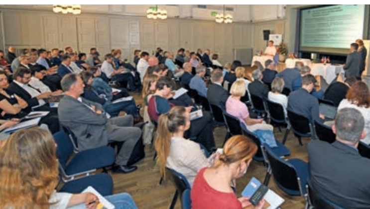
Am Nordwestschweizer Kick-Off für Interreg VI Oberrhein in Basel wurde die neue Förderperiode vorgestellt.

Oberrheinweit fanden fünf Auftaktveranstaltungen statt, um das Programm mit seinen neuen Förderzielen breiten Kreisen der Bevölkerung bekannt zu machen. Bei der Nordwestschweizer Kick-Off-Veranstaltung am 12. Mai in Basel konnten sich Projektinteressierte mit dem Förderprogramm vertraut machen, potenzielle Projektpartner identifizieren und sich von den Kolleginnen und Kollegen des Interreg-Sekretariats sowie von der IKRB beraten lassen. Im Juli konstituierte sich der neue Begleitausschuss der sechsten Förderperiode, bevor er in seiner Sitzung im September die ersten Projekte genehmigte. Mit der Begleitausschusssitzung am 8. Dezember im Basler Rathaus konnten so insgesamt bereits zehn Projekte genehmigt werden, davon sechs mit Schweizer Beteiligung. Die Projekte befassen