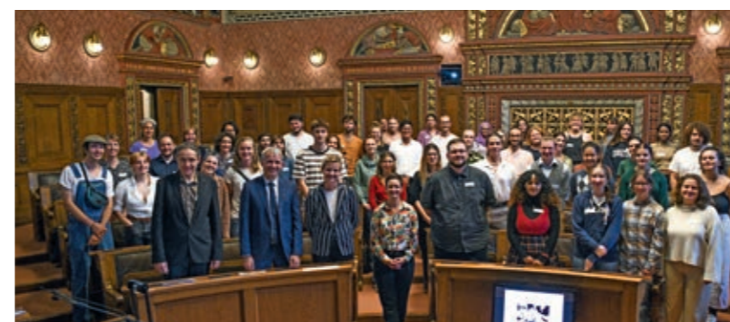
Die Teilnehmenden des Runden Tisches der Jugend zum Klimaschutz diskutierten angeregt zu aktuellen Entwicklungen in den Bereichen Klima, Umwelt und Nachhaltigkeit.

Gemeinsam mit dem Präsidentsdepartement des Kantons Basel-Stadt und dessen Regierungspräsidenten, Beat Jans, lud die Regio Basiliensis am 6. September im Basler Rathaus zum Runden Tisch der Jugend zum Klimaschutz 60 junge Erwachsene aus der Schweiz, Deutschland und Frankreich ein. Die angeregten Gespräche boten die Möglichkeit, Anliegen und Ideen zur grenzüberschreitenden Klima- und Umweltschutzpolitik zu formulieren. Die Ergebnisse des Workshops wurden am 1. Oktober am trinationalen Jugendforum in Rastatt aufgenommen. Das Jugendforum war ein wichtiger Meilenstein für die Erarbeitung der Jugendstrategie der Deutsch-französisch-schweizerischen Oberrheinkonferenz, um deren Anliegen in die grenzüberschreitende Zusammenarbeit aufzunehmen.