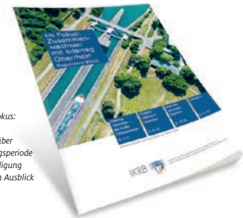
Das Regioninform der IRKB «Im Fokus: Zusammenwachsen mit Interreg Oberrhein» gibt einen Überblick über die vergangene fünfte Umsetzungsperiode und die Nordwestschweizer Beteiligung an Interreg Oberrhein sowie einen Ausblick auf die sechste Förderperiode.

Das von der EU 1990 ins Leben gerufene Förderprogramm Interreg verfolgt das Ziel, den Dialog und die Zusammenarbeit der Regionen in Europa zu fördern sowie die Entwicklungsunterschiede in den Regionen zu mindern. Als «Europäische territoriale Zusammenarbeit» ist es Teil der EU-Kohäsionspolitik. Die über 70 Interreg-Programme sind in drei Ausrichtungen aufgeteilt: Interreg A fördert die nachbarschaftliche Kooperation in grenzüberschreitenden Regionen, Interreg B fördert in grossen, geographisch zusammenhängenden Räumen wie dem Alpenraum und Interreg C unterstützt den Erfahrungsaustausch auf dem ganzen Kontinent. Die Kooperationsprojekte geben neue Impulse und schaffen wichtige Synergien über die Grenzen hinweg. Davon profitieren auch Akteure der Nordwestschweiz, die sich seit Programmbeginn an Interreg A Oberrhein beteiligen.