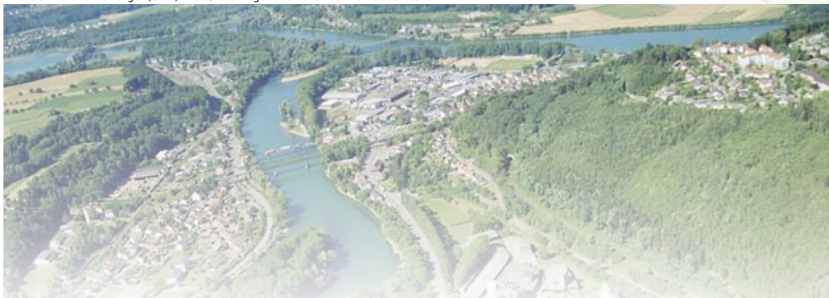
Koblenz - Waldshut-Tiengen (CH-D).

Informationen über SCoT-Gebiete sowie allgemein über französische administrative Raumeinheiten stehen unter http://www.territoires.gouv.fr/indicateurs/portail_de/index_de.php zur Verfügung