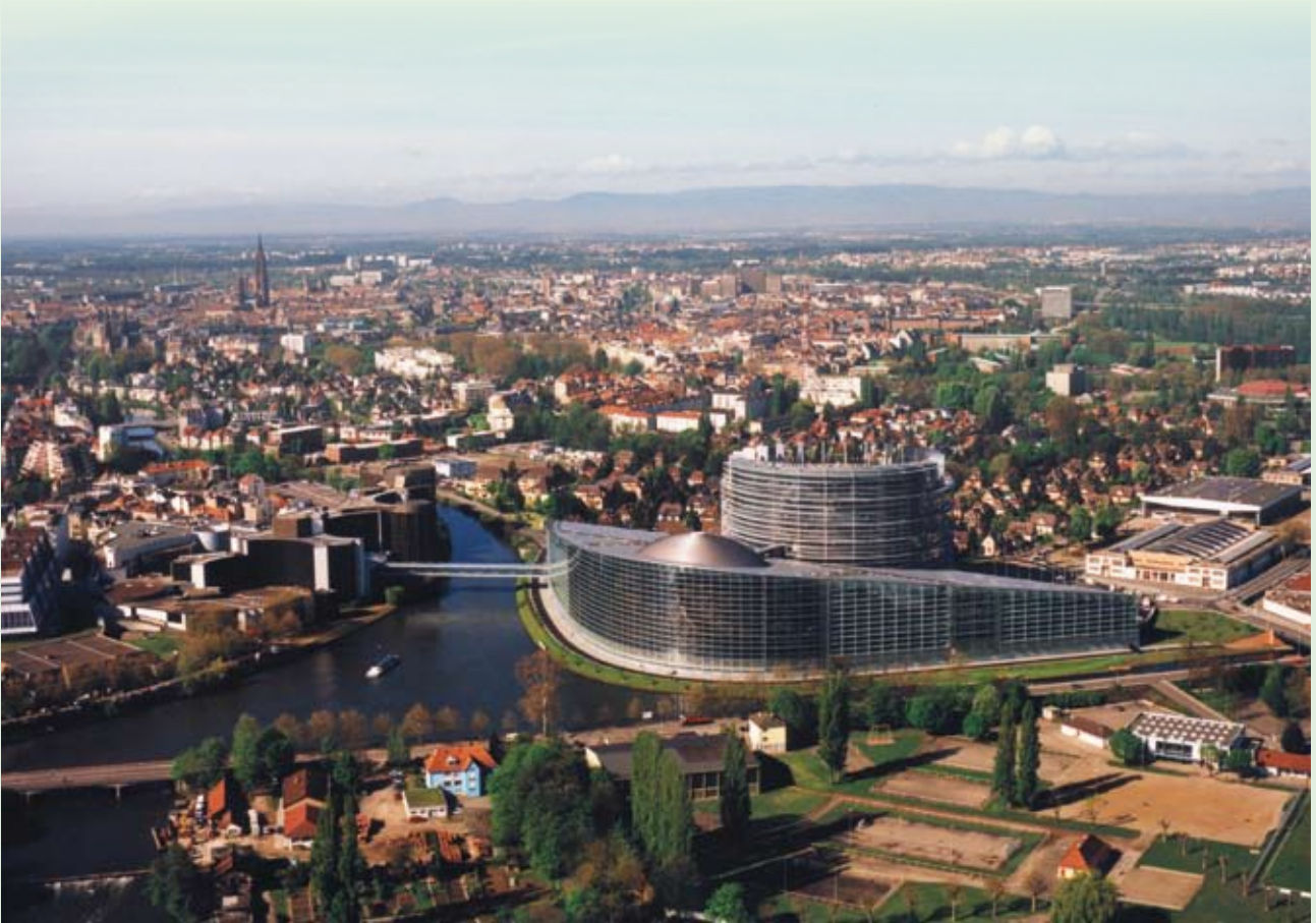
Strasbourg, Parlement Européen / Europaparlament, Straßburg (F).