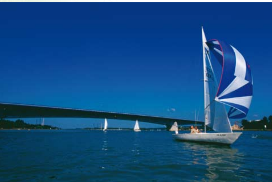
Pont / Brücke Pierre Pflimlin (F-D).