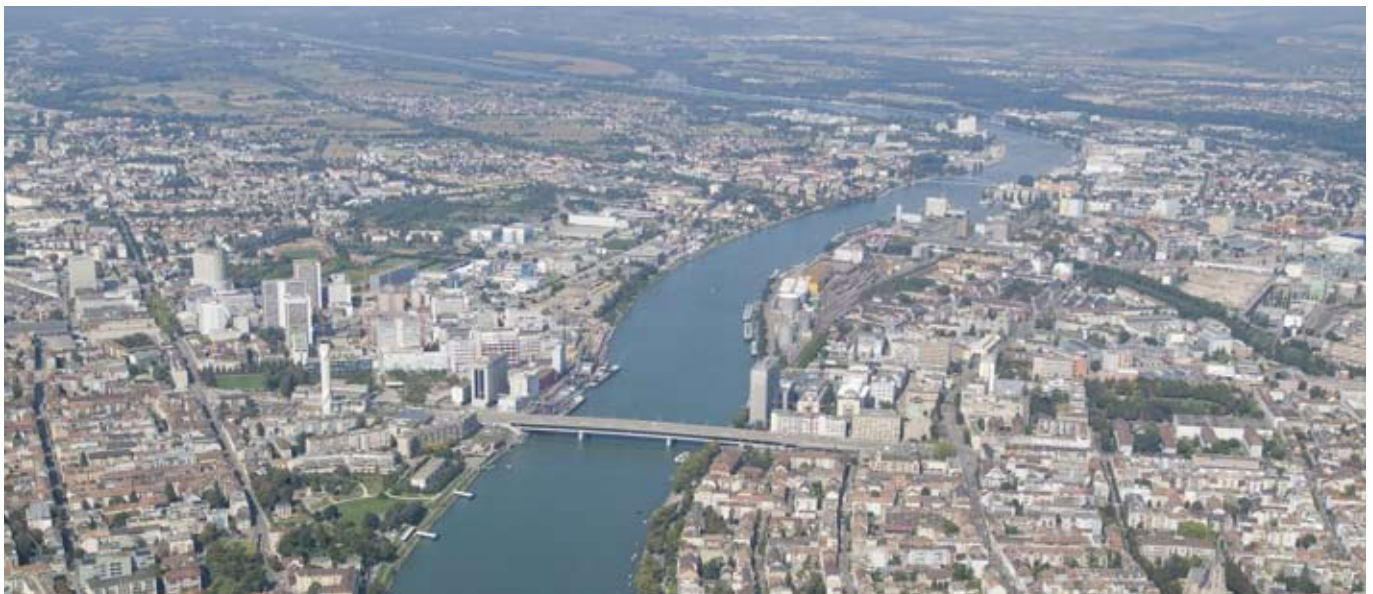
L'agglomération Bâloise / Agglomeration Basel (CH-D-F).

Auf der Karte ist die Abgrenzung des künftigen SCoT dargestellt. Gemeinden, die nicht vom bisherigen Schéma Directeur abgedeckt wurden, sind in diesem Teilraum weiß dargestellt.