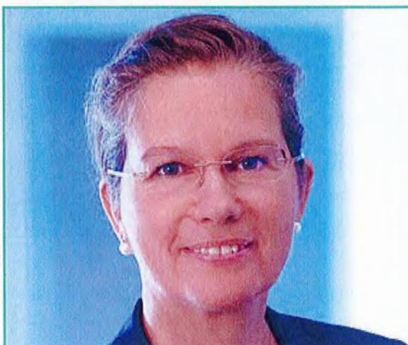
Diana Stöcker, Bundesabgeordnete für den Bundestagswahlkreis Lörrach-Müllheim