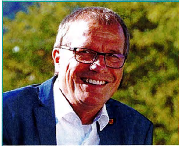
Klaus Eberhardt, Oberbürgermeister der Stadt Rheinfelden (Baden)